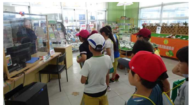
その他の児童は案内所内を自由に見学したり、疑問に思ったことを職員に質問したりしました。