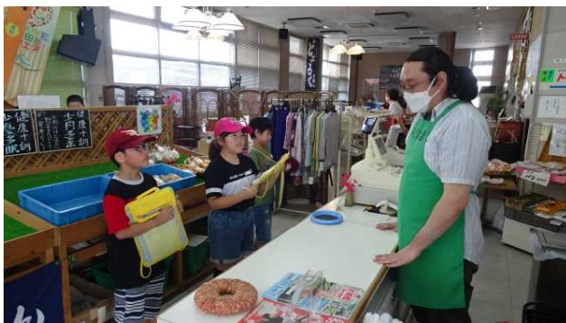
しぜんチームは、メモをとりながら知りたいことをどんどん質問しました。