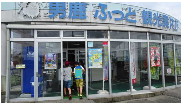
しぜんチームを中心とした学習ですが、地域を知る貴重な機会なので3年生全員で男鹿ふっと観光案内所を訪問しました。