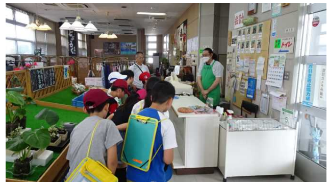
まずは全員で「よろしくお願ひします」と挨拶しました。